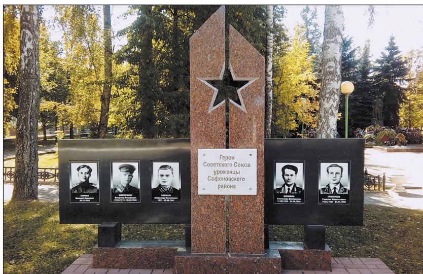
Аллея героев Советского Союза